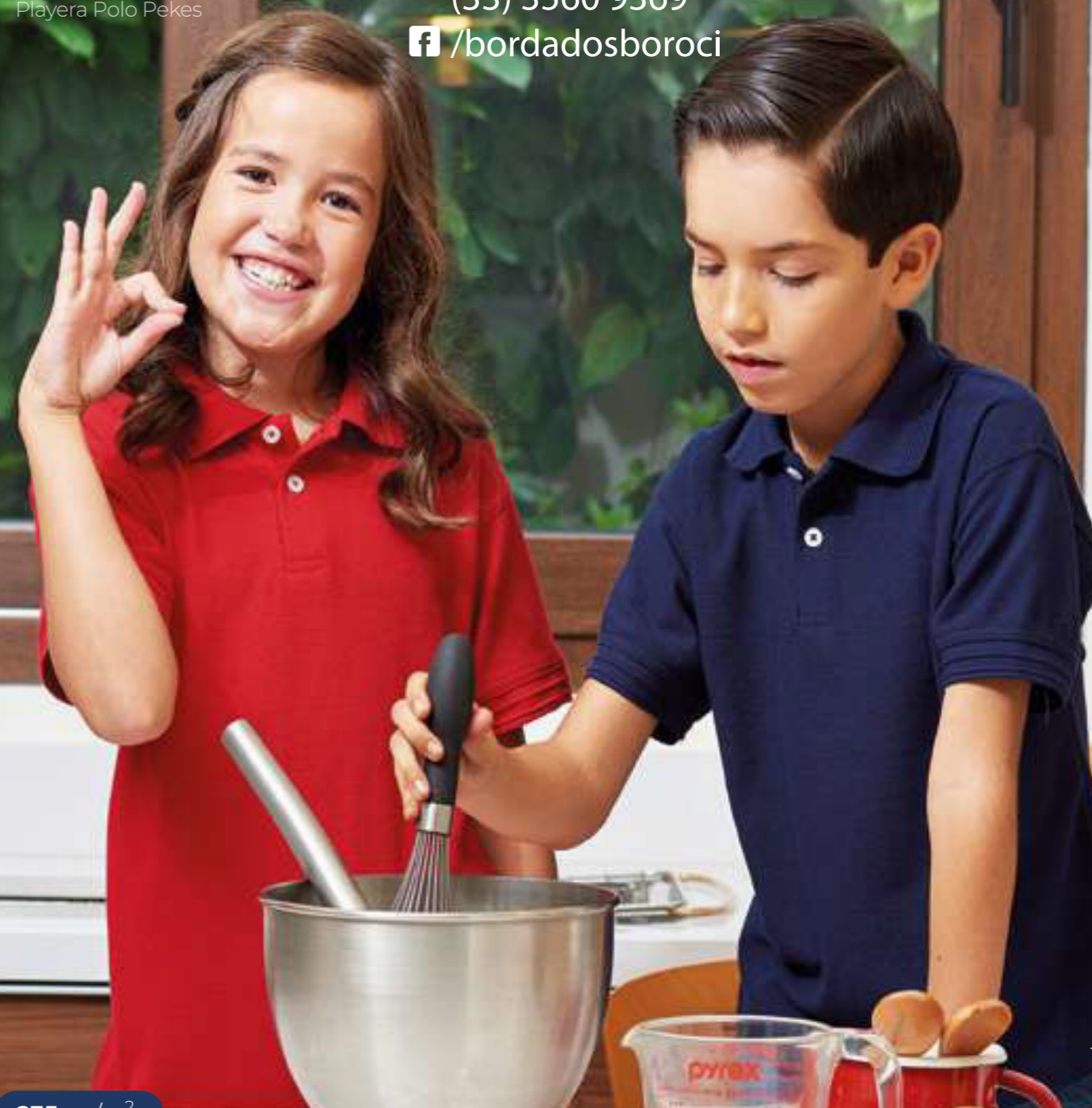
Playera Polo Pokes